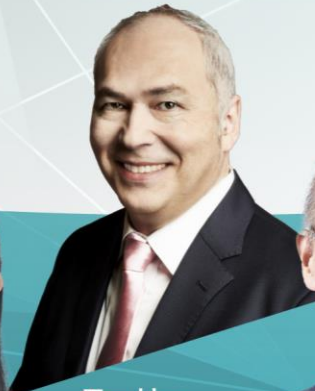
モーリー ロバートソン