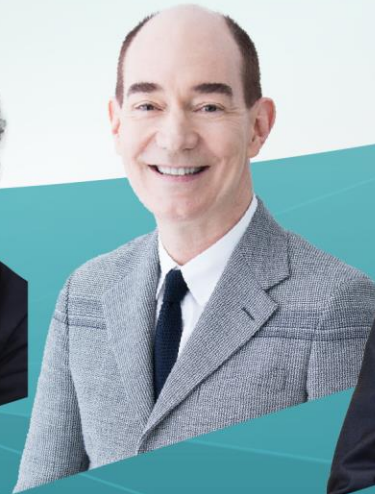
ロバート キャンベル